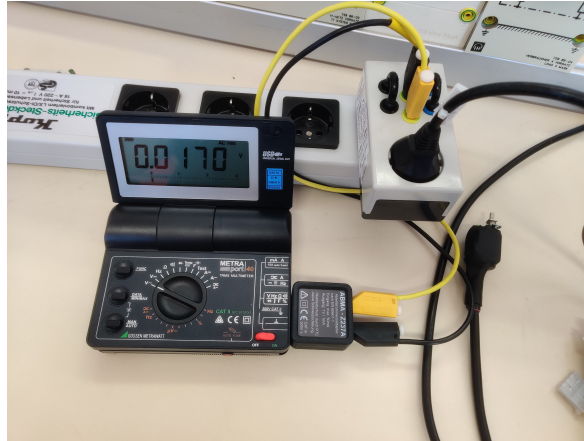
Abbildung 2: Messaufbau Ableitstrom